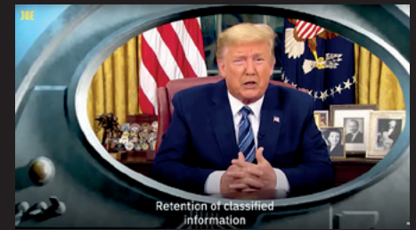
Twee stills uit de video 'It wasn't me', met de AI-versies van Poetin en Trump.